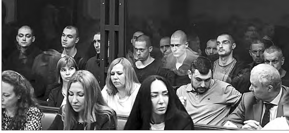
Під час проведення судилища в РФ над військовослужбовцями батальйону «Азов».